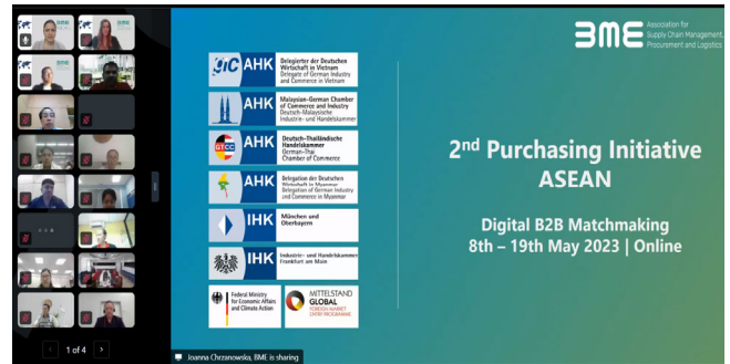
Digitale Eröffnung der Einkaufsinitiative ASEAN 2023

oav GERMAN ASIA-PACIFIC BUSINESS ASSOCIATION